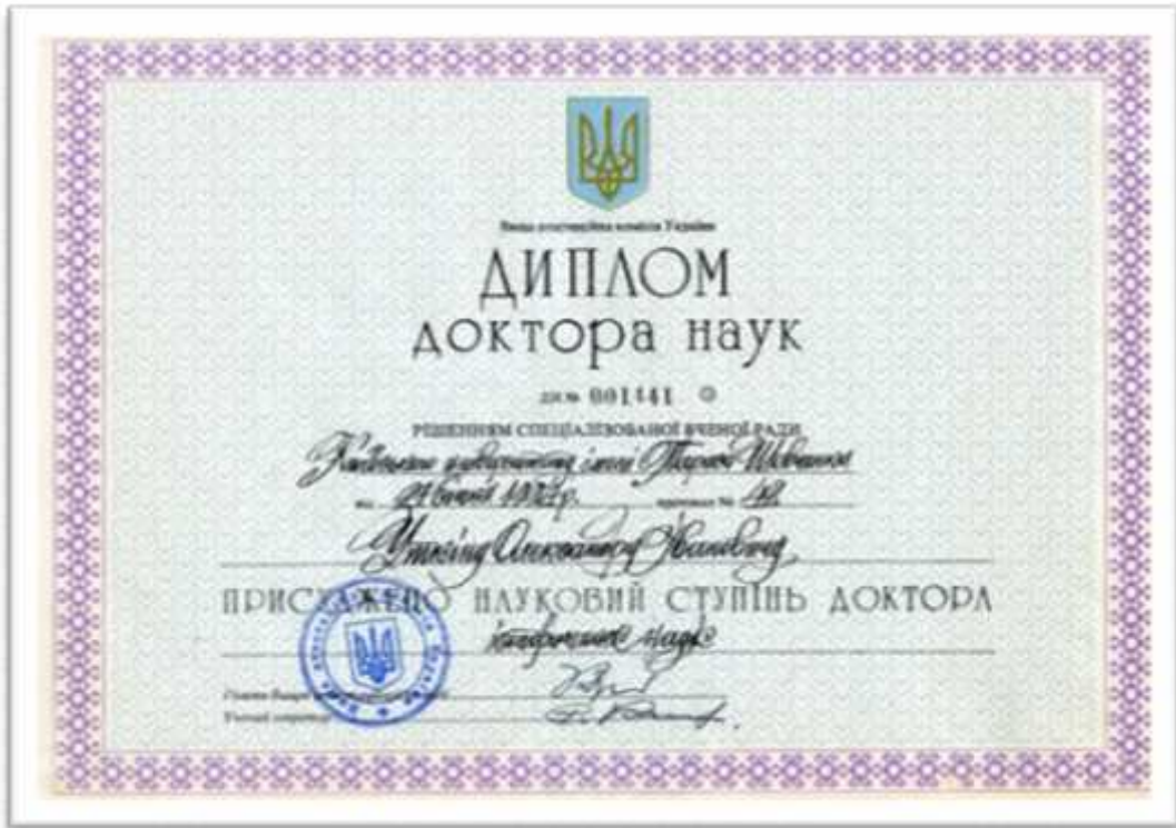
, 1994 .