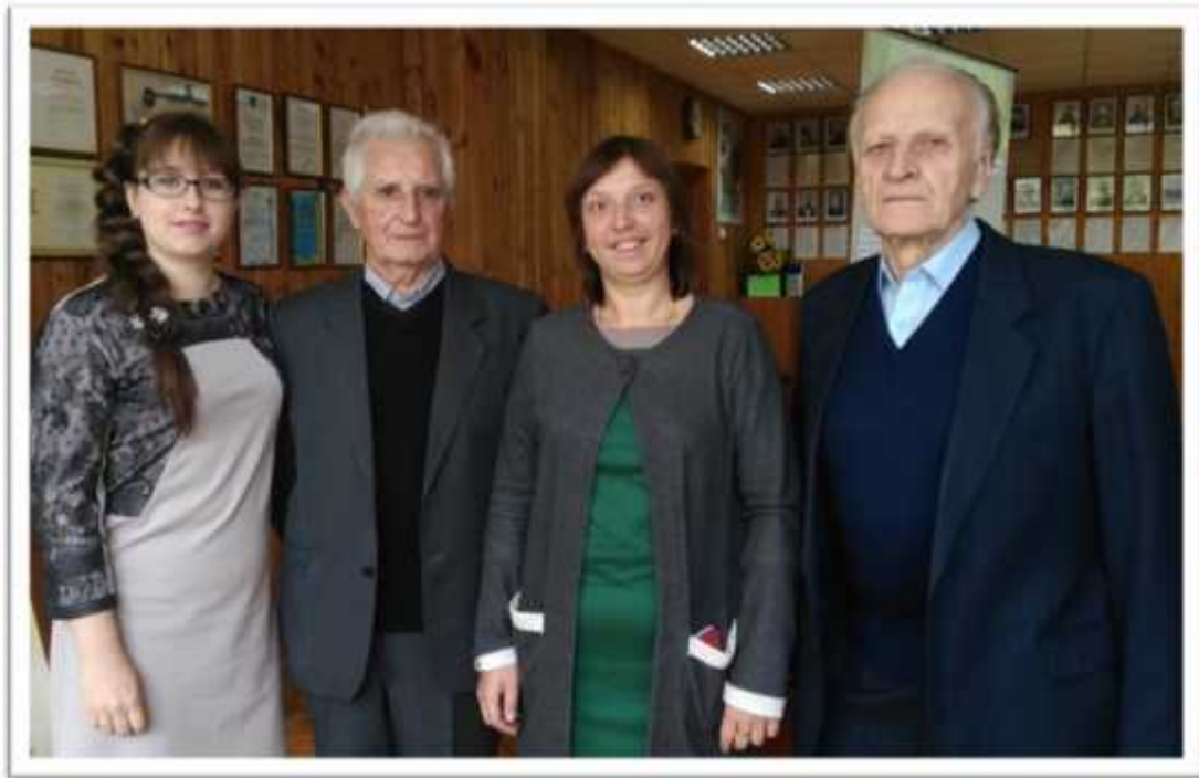
, , : , , , , . . , , , . . , , , . . ,