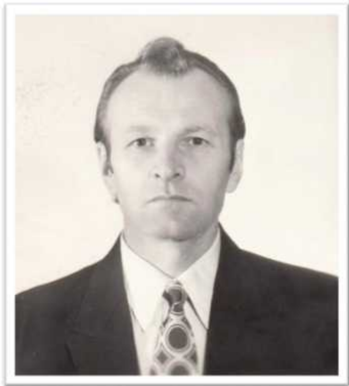
.. - 1972 . . . . ,