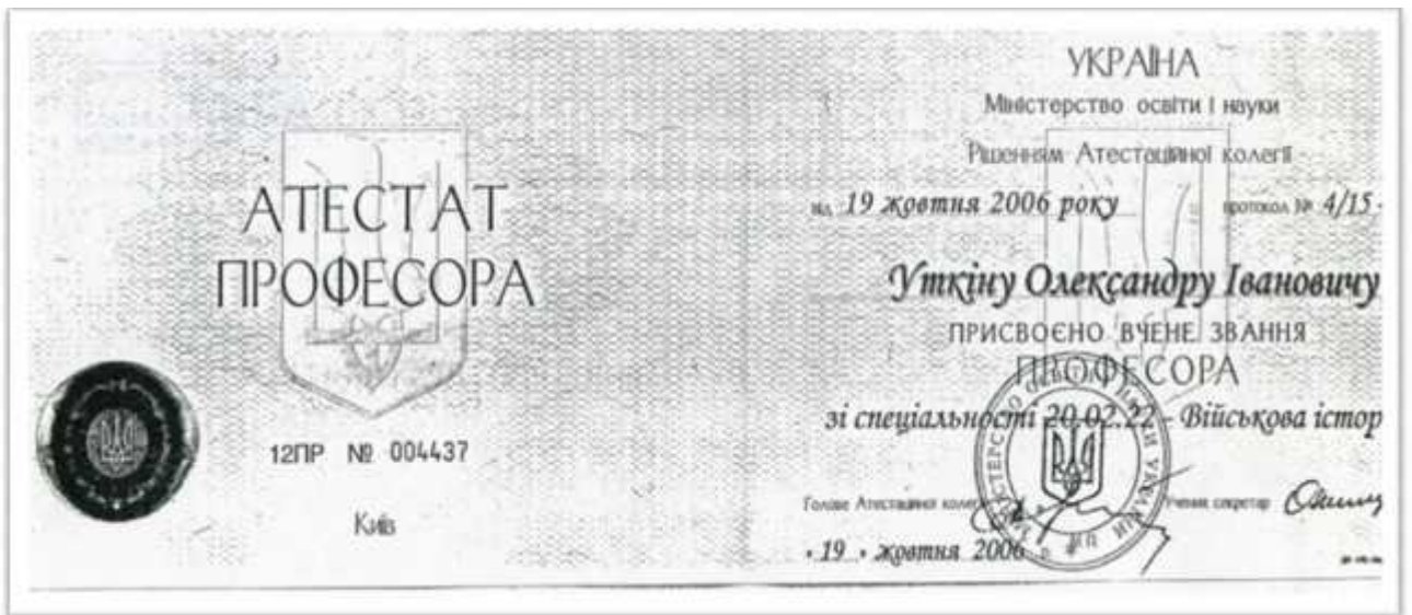
, 2006 .