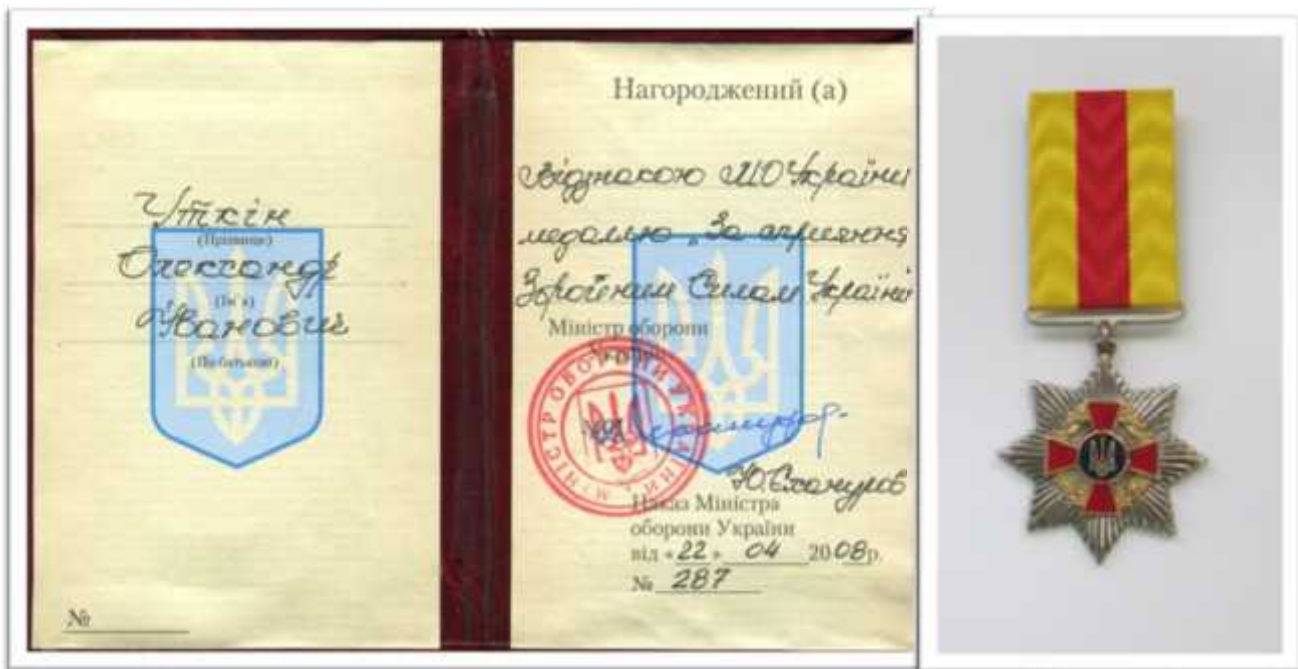
« , 2008 .