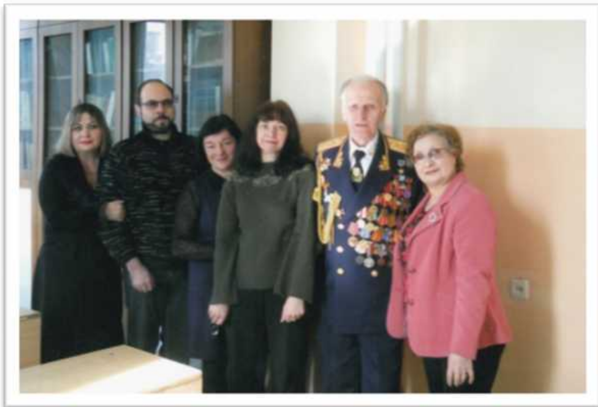
, 2010 .