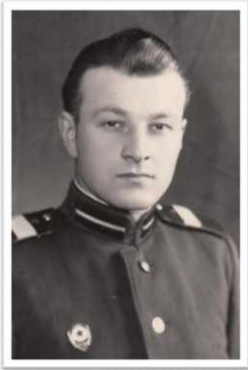
.. - ,1959 .