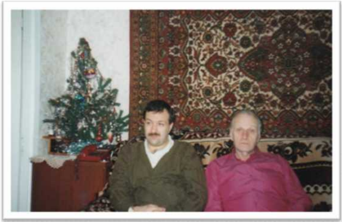
.. ,2005 .