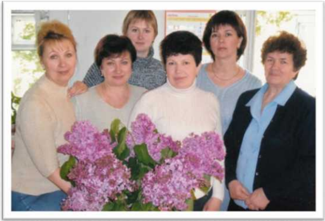
« - », 2010 .