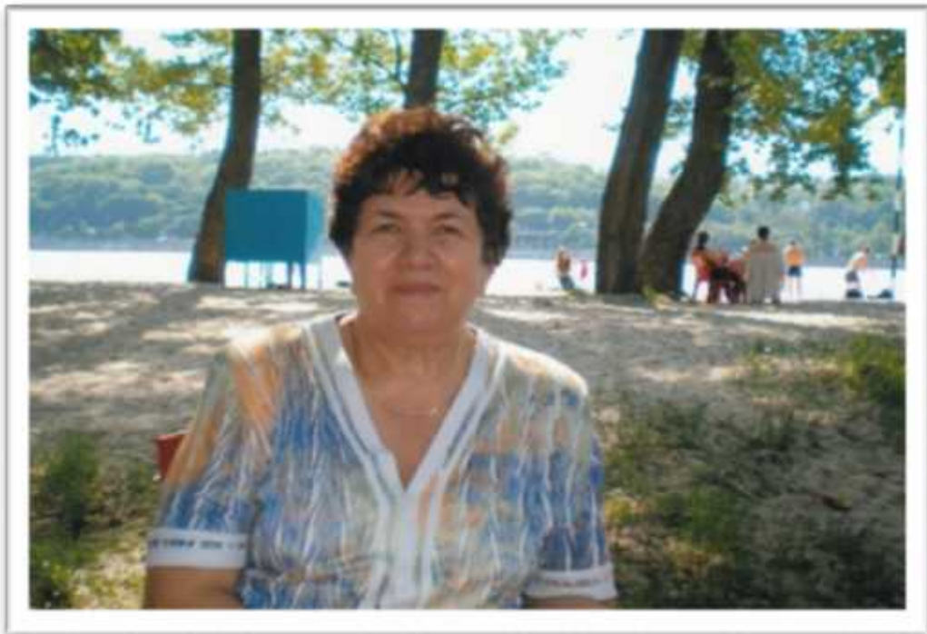
. . , 1995 . ,