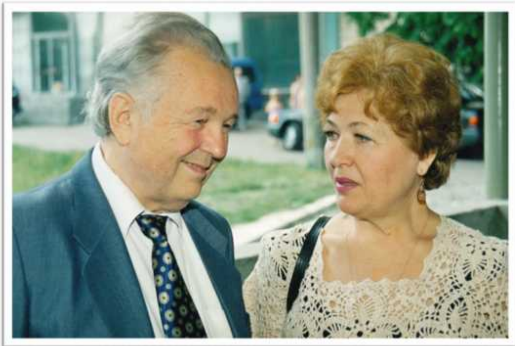
( . . - )