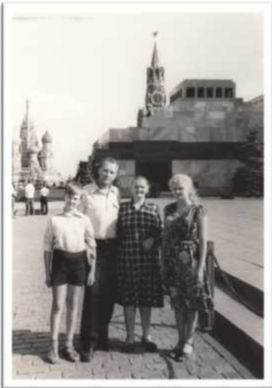
.. , .. ,1980 .