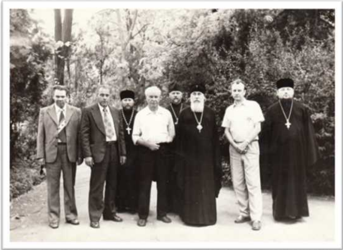
, 1978 .