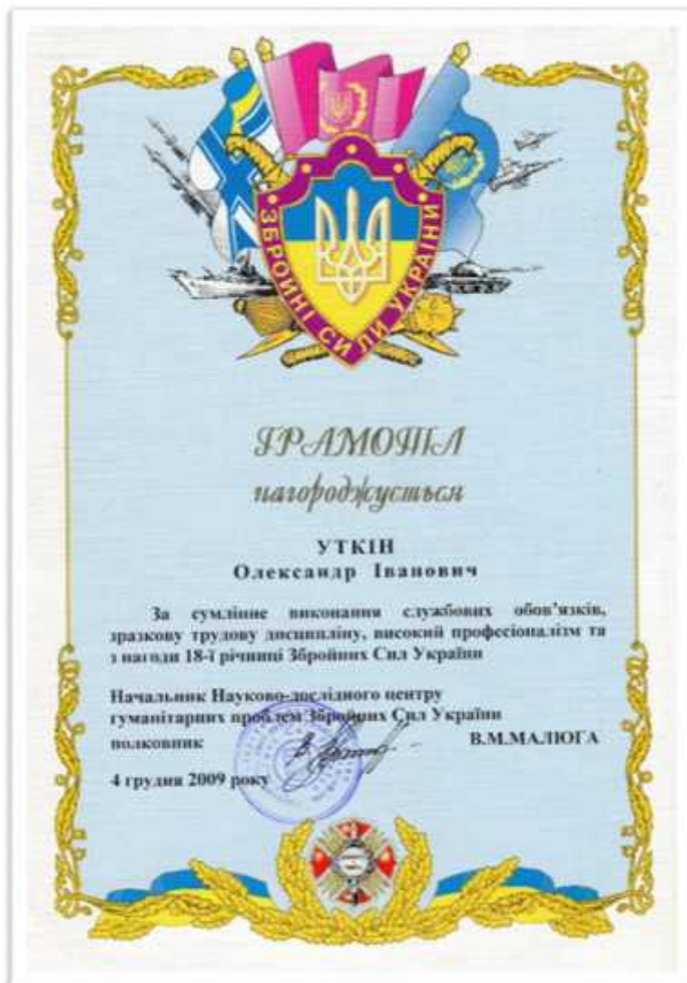
18- , 2009 .