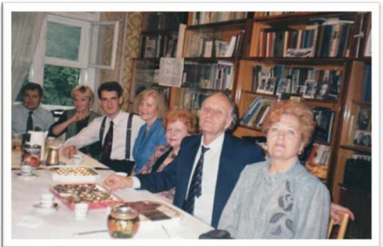
. . . . . , 1998 .