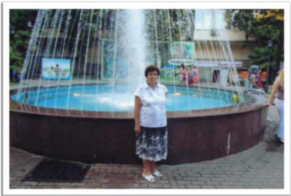
. , 1995 .