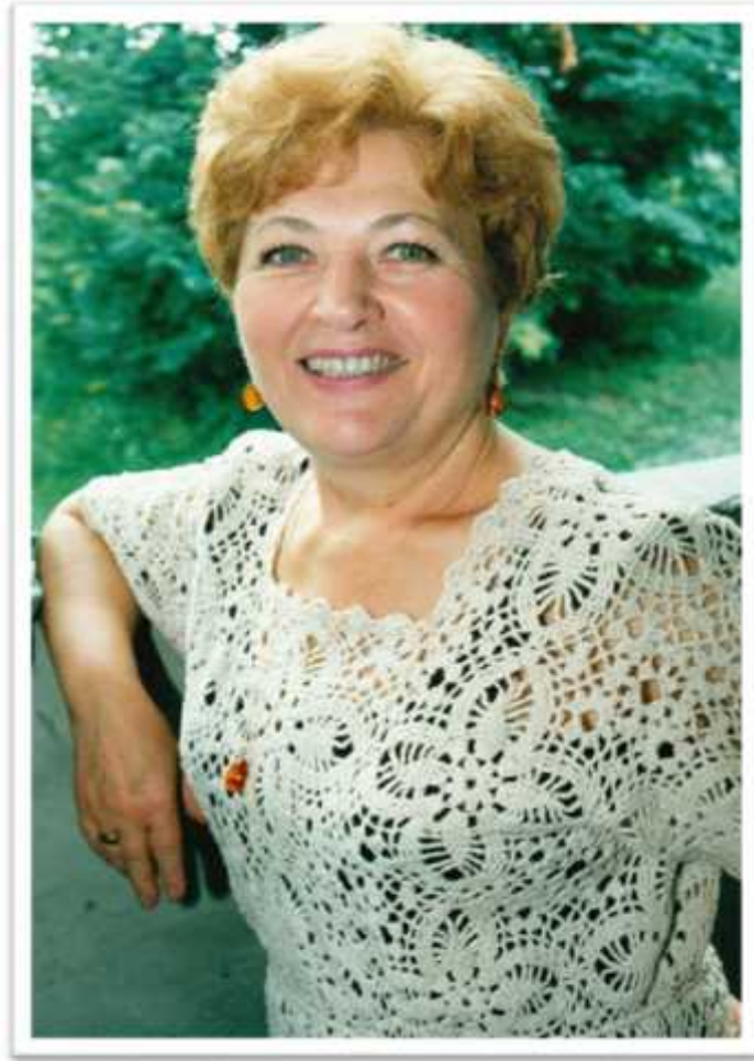
( , - )