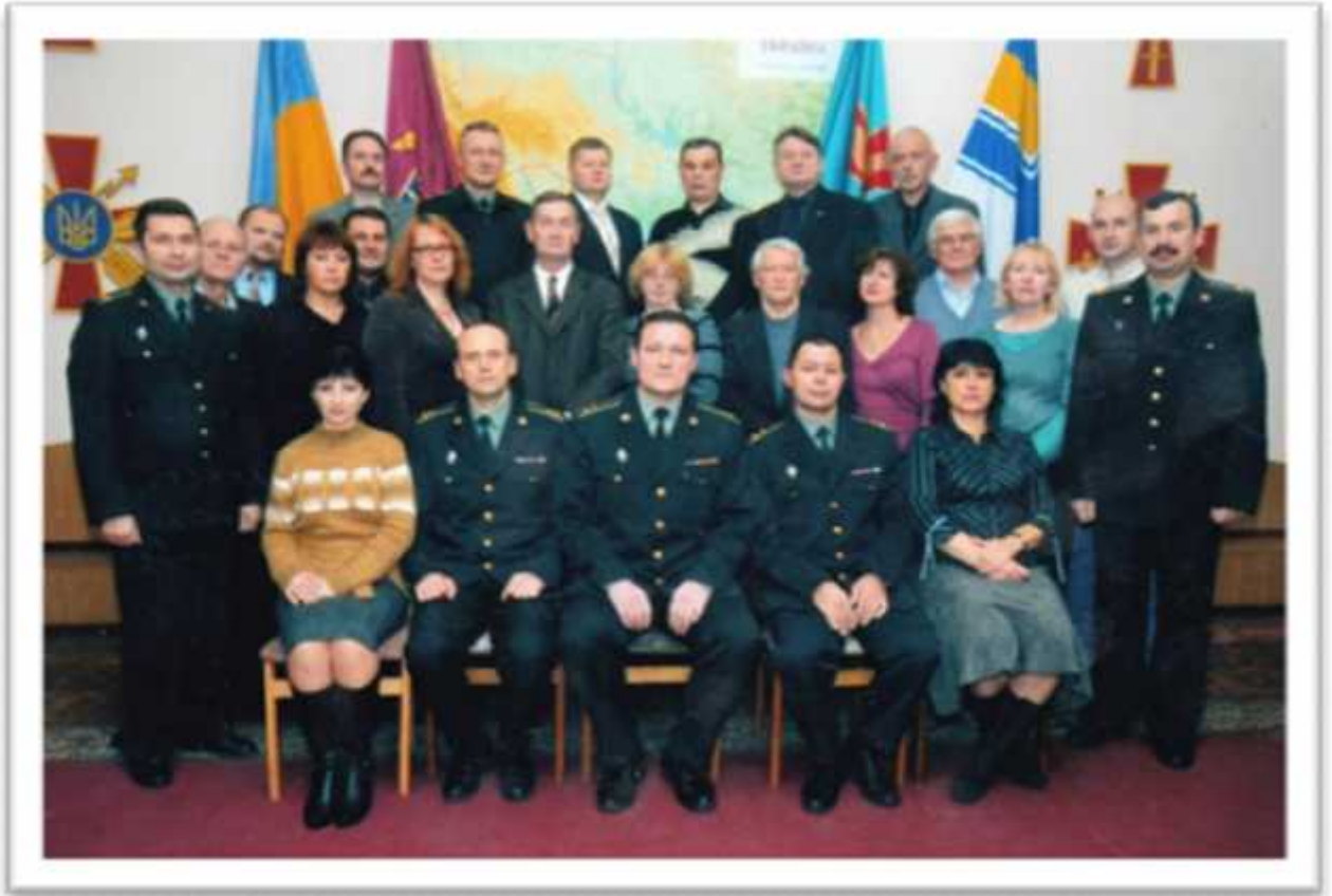
, 2007 .