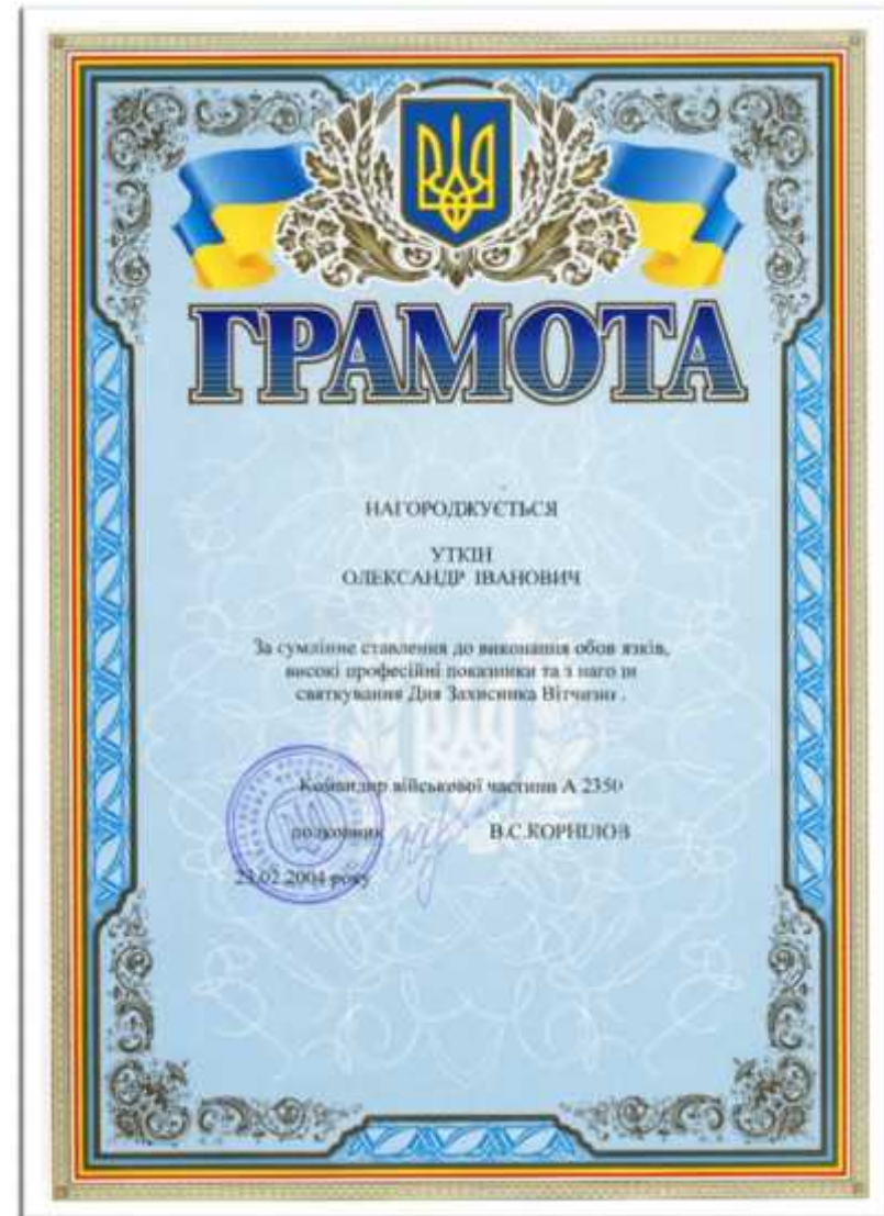
, 2004 .