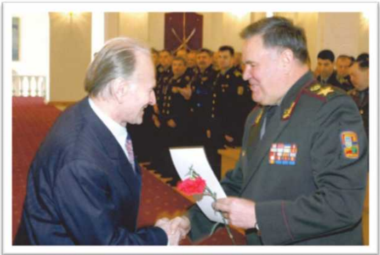
.. , .. ,2007 .