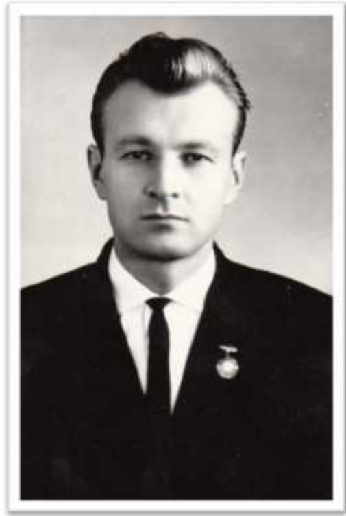
.. - ,1965 .