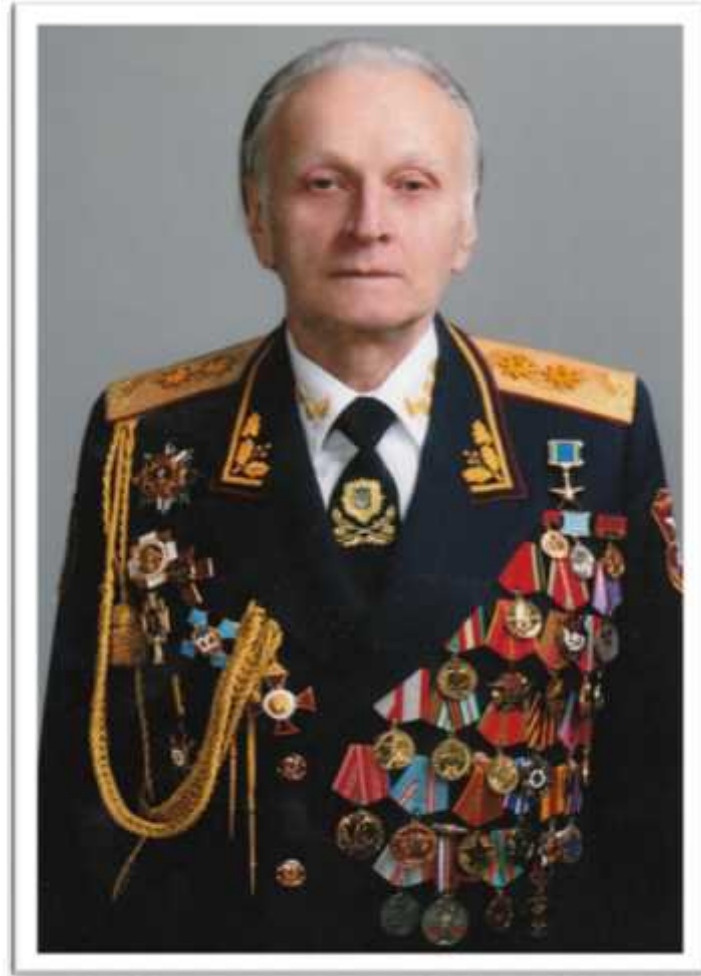
- , 2017 .