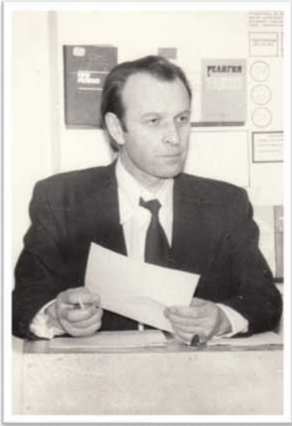
.. ,1977 .