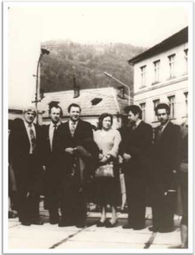
.. - . . . .. ,1981 .