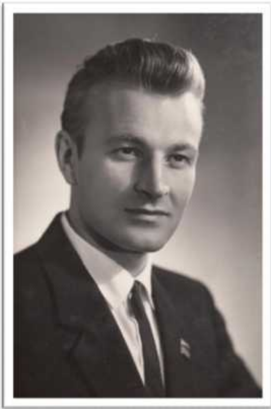
.. ,1967 .