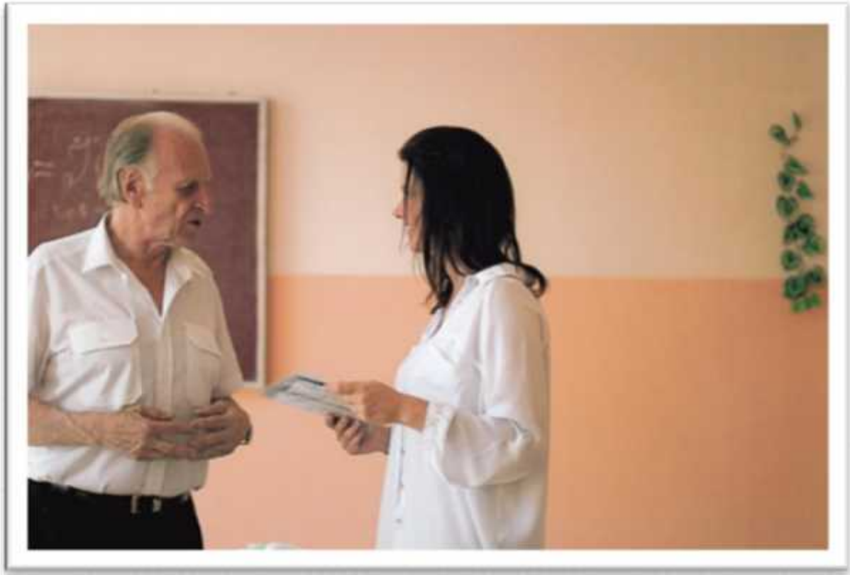
. , 2012 .