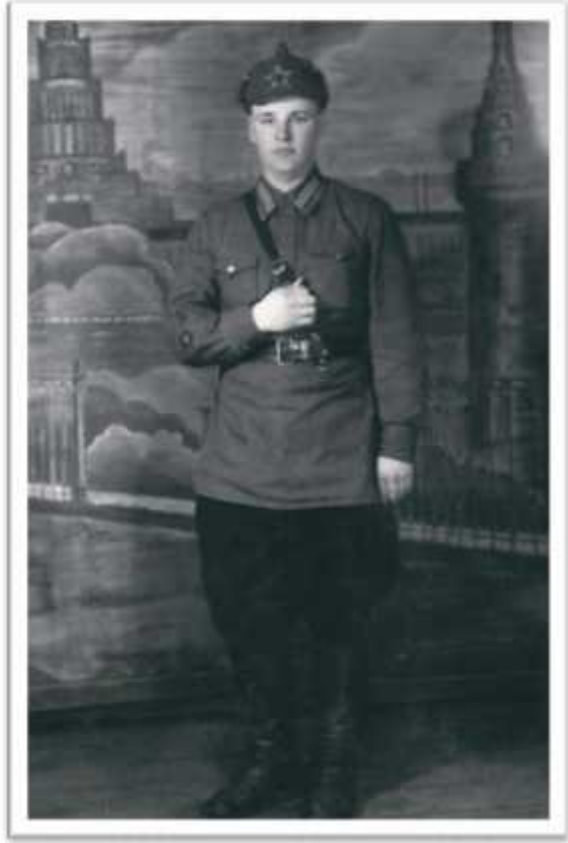
, 1941 .