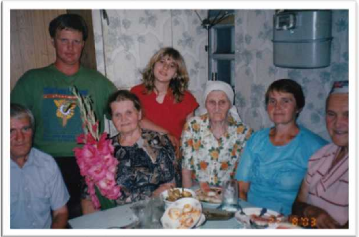
, 2003 .