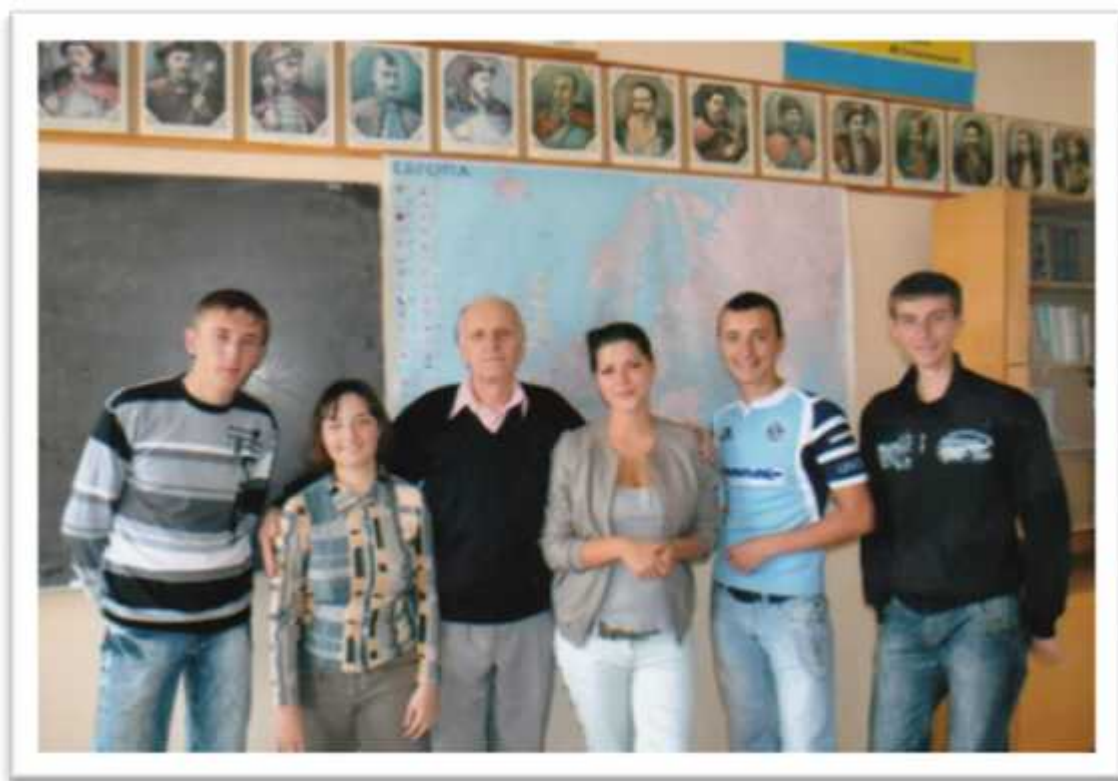
- , 2012 .