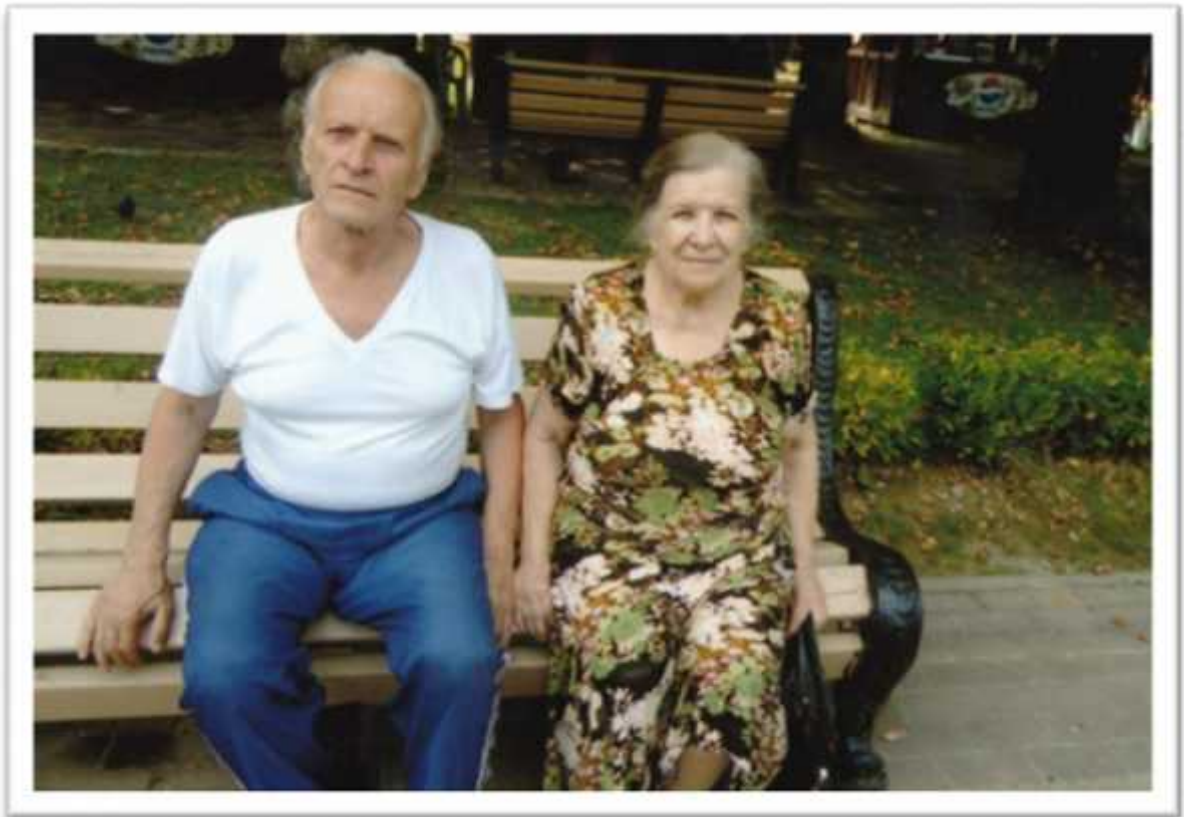
. , 2012 .