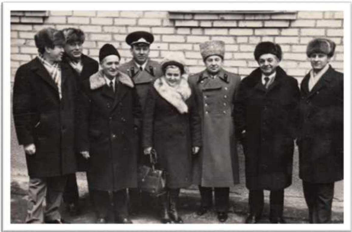
, 1980 .