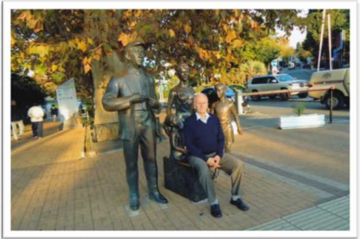
. , 2010 .