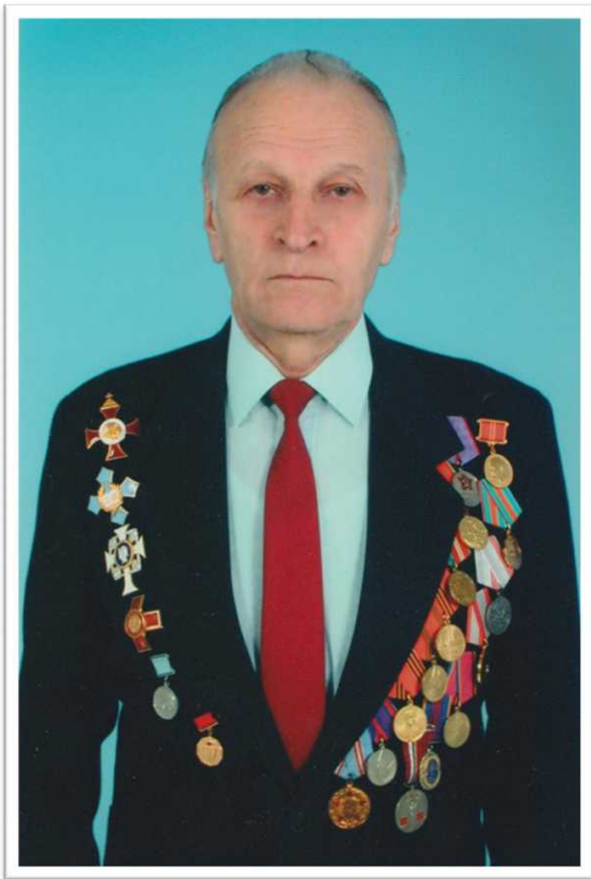
.. , 2008 .