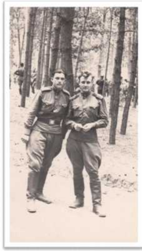
, 1958 .