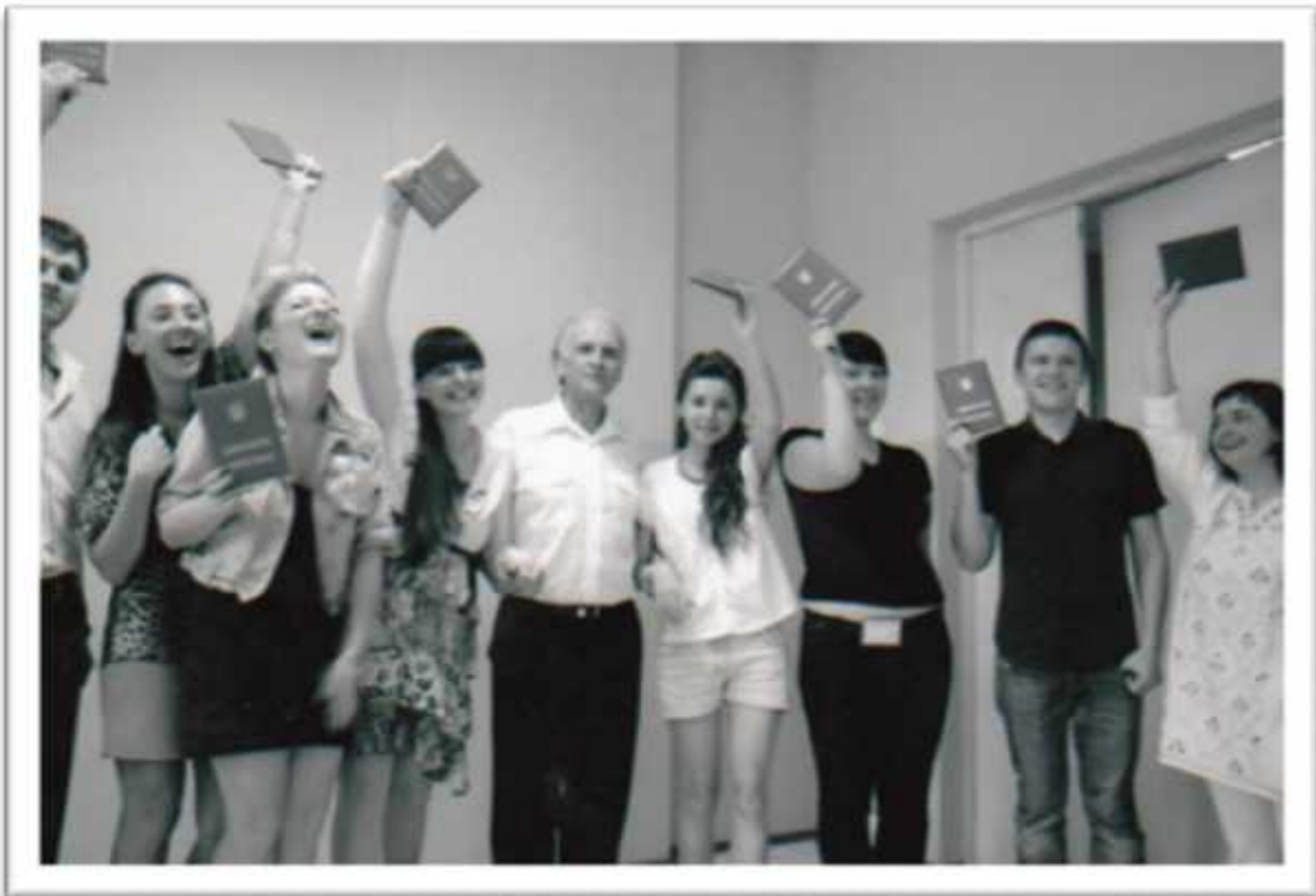
. , 2012 .