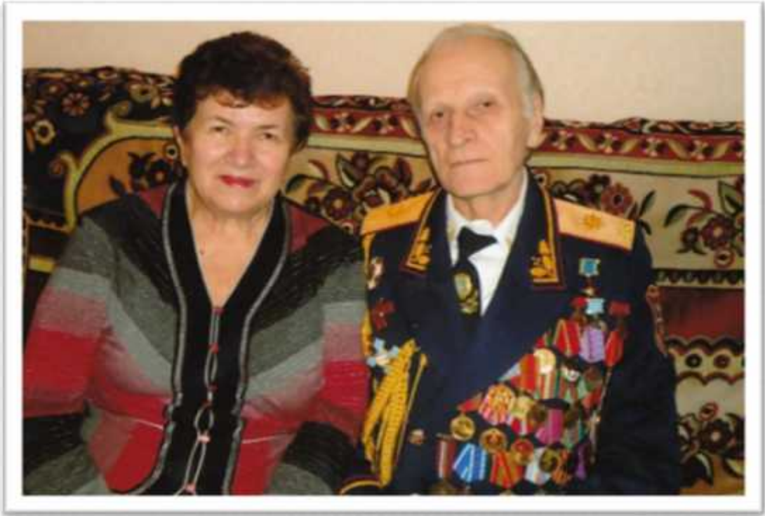
.. , 1992 .