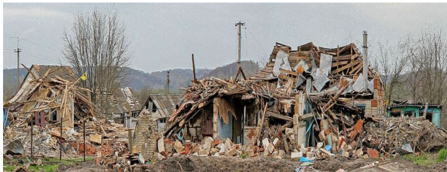
Зруйновані будинки цивільних у м. Боромля (Сумська обл.) від російських КАБів у березні 2022 р.