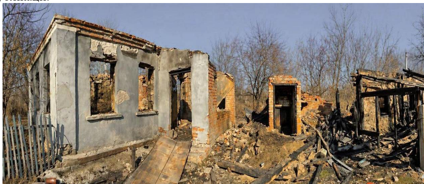
Зруйнований родинний будинок автора у Сумському р-ні Сумської обл. від обстрілу рашистів у 2024 р.