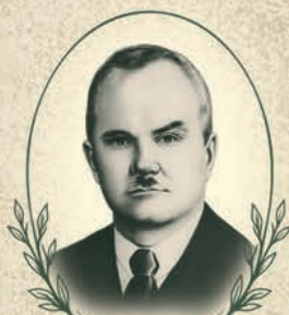
МАХОВ Григорій Григорович (1886–1952)