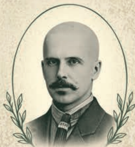
ТЕРНИЧЕНКО Аристарх Григорович (1886–1927)