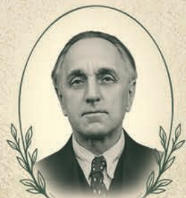
ДЖОВАНІ Діонісій Олександрович (1886–1971)