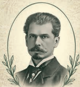
ВИНОГРАДСЬКИЙ Сергій Миколайович (1856–1953)