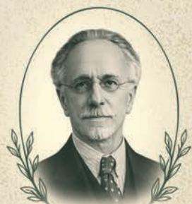
РОТМІСТРОВ Володимир Григорович (1866–1941)

матеріали XXI Всеукраїнської наукової конференції молодих учених та спеціалістів присвяченої ювілейним датам від дня народження видатних учених в галузі аграрних наук