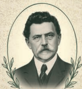
ФРАНКФУРТ Соломон Львович (1866–1954)